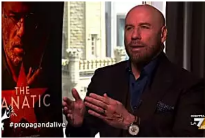
L'intervista impossibile a John Travolta su Sanremo è tutta da ridere: 'Ho ricevuto 50€ su Paypal'