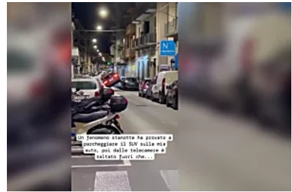
Il SUV sale sulle auto parcheggiate in strada a Bari e ne distrugge una ventina: 'Completamente devastate'