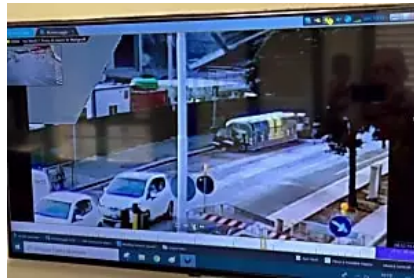
Ore 8.52: il momento del crollo nel cantiere Esselunga